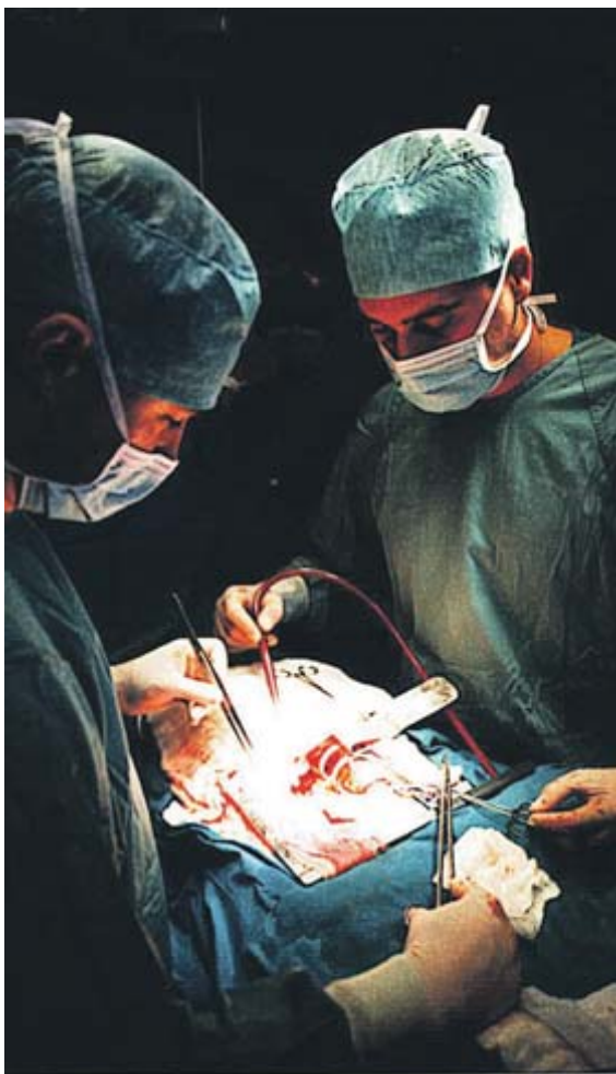
Una operación de trasplante de riñón en el Hospital de Cruces. ■ bv

La opción del trasplante cruzado de donante vivo ofrece a los pacientes –por lo general menores de 50 años– con insuficiencia renal crónica la posibilidad de recibir un trasplante de riñón de donante vivo, gracias a la generosidad de un familiar, aunque éste no sea compatible.